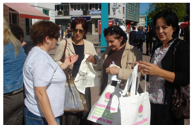
Detalj sa ulične akcije, oktobar, 2012, Glas žene, Bihać