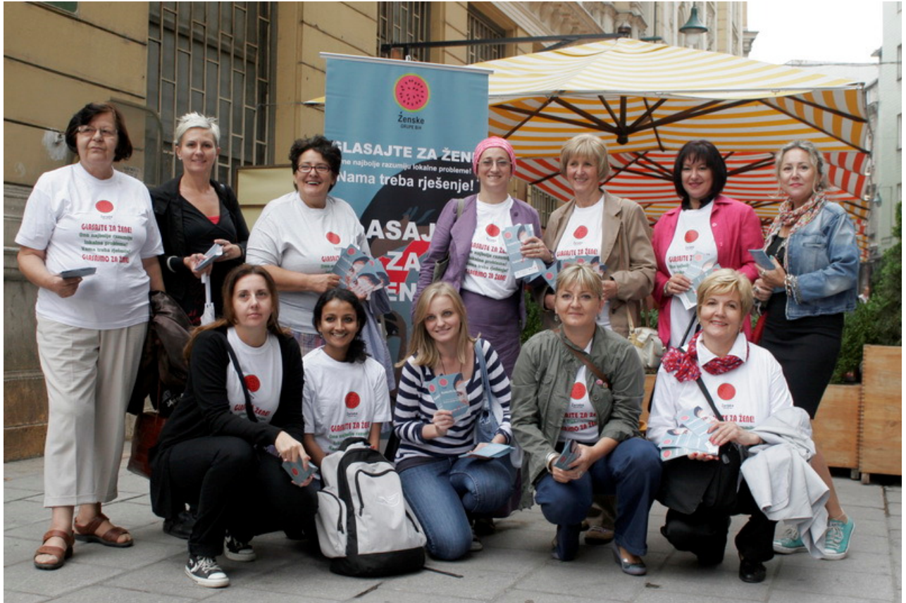
Ulična akcija Sarajevo, septembar, 2012.

U nastavku slijedi pregled medijskih aktivnosti tokom septembra, koje su se odvijale paralelno sa predizbornom kampanjom, što je dodatni izazov jer je pažnja medija posebno fokusirana na političke stranke i njihove aktivnosti.