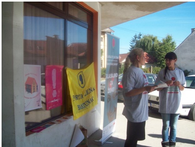
Detalj sa ulične akcije, Forum žena Bratunac, oktobar, 2012.