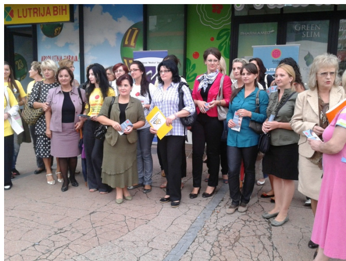
Sa ulične akcije Medica Zenica, septembar, 2012