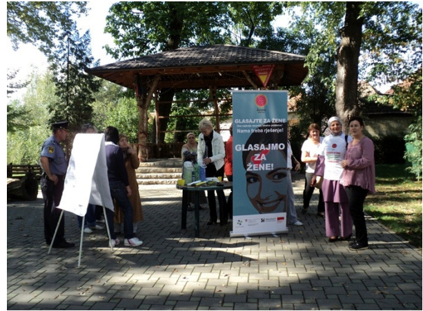
Detalj sa ulične akcije, oktobar, 2012., Krajiška suza Sanski Most