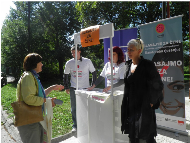
Detalj sa ulične akcije, oktobar, 2012, Institut za razvoj mladih KULT, Sarajevo-Ilidža